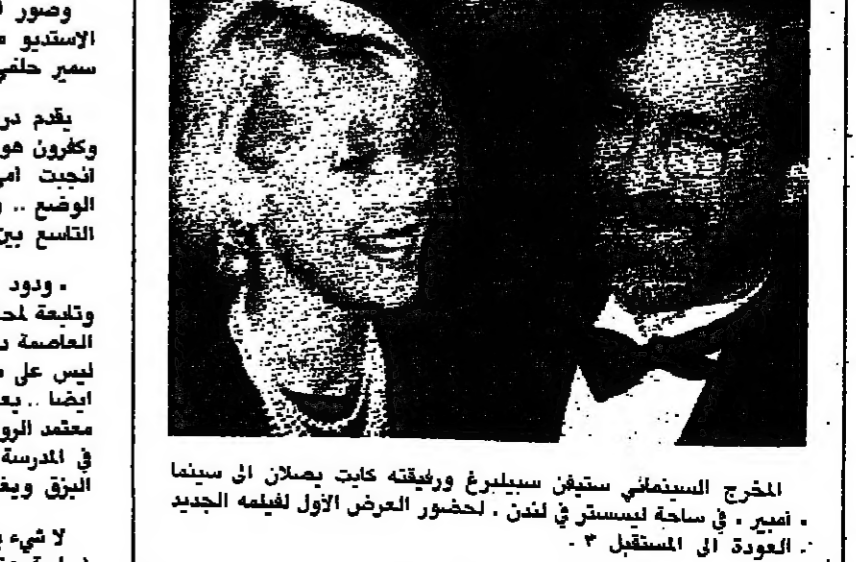
المخرج السينمائي ستيفن سبيليرج ورفيقته كايت يصلان الى سينما «امير» في ساحة ليستر في لندن، لحضور العرض الاول لفيلمه الجديد «العودة الى المستقبل ٣»